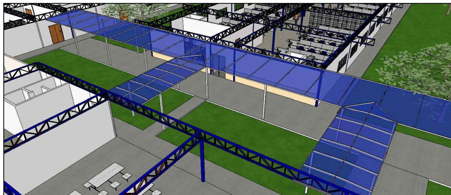
PASSARELA-IMAGEM ILUSTRATIVA ESCALA: S/ ESCALA